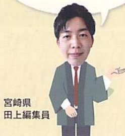
宮崎県 田上編集員

宮崎は温泉のイメージがあまりないかもしれませんが、穴場スポットなど沢山ありますので是非この機会に遊びに来てください♪